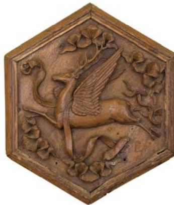
Panneau sculpté d'un cerf ailé et d'une ceinture d'espérance, Emblème des ducs de Bourbon, Atelier bourbonnais, bois, vers 1500, musée Anne-de-Beaujeu

Durant la période médiévale et à la Renaissance, l'imaginaire collectif déborde de griffons, de chimères et de licornes. L'animal est aussi utilisé comme un emblème, c'est le cas des Bourbons qui choisissent le cerf ailé .