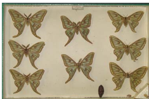
Collection de lépidoptères, musée Anne-de-Beaujeu

Il administre le Jardin des Plantes qu'il remodèle et agrandit en y créant un musée. Son œuvre, l' Histoire Naturelle publiée entre 1749 et 1789 a pour objet de dresser l'inventaire des connaissances sur les espèces animales et végétales. Il concentre ses recherches sur les minéraux ainsi qu'une partie des animaux (quadrupèdes et oiseaux).