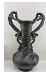
Vase orné de deux dragons formant anses, Chine, bronze, 19 e siècle, musée Anne-de-Beaujeu