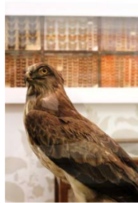
Circaète Jean le Blanc, oiseau naturalisé, musée Anne-de-Beaujeu

En France, c'est Georges-Louis Leclerc, comte de Buffon, qui marque une avancée des connaissances dans ce domaine.