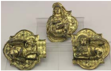
Extrémités de d'une croix processionnelle (il manque l'aigle) Limoges, cuivre doré, 15 e siècle, musée Anne-de-Beaujeu

Les évangélistes sont également symbolisés par des animaux comme le taureau pour Luc, le lion pour Marc, l'aigle pour Jean. Mathieu est représenté par un ange. C'est ce que l'on appelle le tétramorphe , que l'on retrouve souvent sur les croix médiévales.