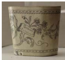
Cornet à dés ?, Tyrol, corne, 19 e siècle, musée Anne-de-Beaujeu

Au fil du temps, nacre, os, perle, ivoire, plume, galuchat, corail, sont considérés comme précieux. Ces matières premières sont utilisées en joaillerie ou encore dans les arts décoratifs.