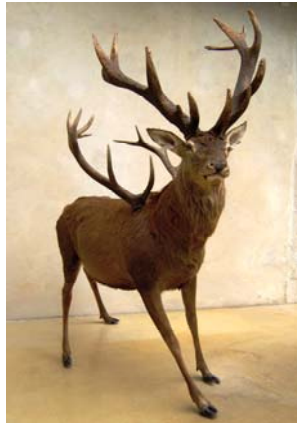
Sans titre (cerf-volant) , Thomas Monin, cerf naturalisé, 2009, Courtesy Galerie Barnoud, Dijon

Thomas Monin (né en 1973) s'interroge quant à lui sur la place de l'animal sauvage et domestique. Connu pour ses créations imposantes, il utilise souvent la taxidermie à laquelle il ajoute une composante originale dans la présentation ou dans l'apparence physique de l'animal. Il soulève les questions de la survie de l'animal, de la préservation des espèces, et du rôle que l'homme lui attribue.