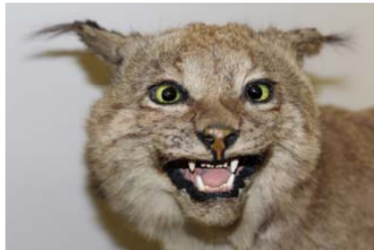
Lynx, animal naturalisé, 19 e siècle, musée Anne-de-Beaujeu

Elle consiste à traiter l'animal mort afin de le conserver. La peau est tannée pour créer un cuir souple et imputrescible, puis on construit une armature pour ajuster cette dernière. Le remplissage garantit le volume et la forme initiale. C'est au 18 e siècle que cette pratique connaît d'importants développements, autorisant la naturalisation d'animaux entiers.