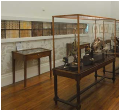
« Animalement vôtre » première salle

Le travail de classification de la faune et de la flore existe depuis l'antiquité. Il prend une autre ampleur au cours du 18 e siècle avec le botaniste suédois Carl Von Linné qui établit un nouveau système de classification en regroupant les espèces entre elles. Il propose une nomenclature universelle en langue latine afin que tous les nouveaux animaux soient nommés d'une même manière, intelligible par tous. C'est selon ce modèle que sont identifiés tous les oiseaux exposés dans la première salle.