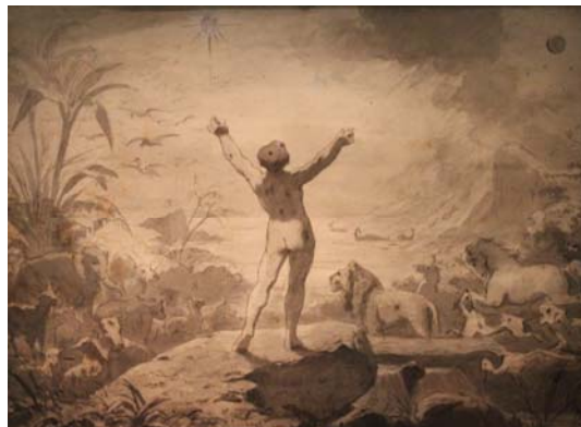
Adam baptisant les animaux , anonyme, école française ou anglaise, Lavis d'encre sur papier, fin du 18 e ou début du 19 e siècle, Collection particulière

La culture chrétienne considère l'animal comme une créature au service de l'homme. Selon la Genèse, Dieu créé les animaux le cinquième jour, l'homme le sixième jour. Adam baptise les animaux , leur donnant un nom. C'est une manière de marquer sa domination sur le monde vivant qui l'entoure.