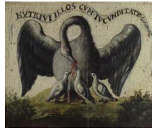
Pélican nourrissant ses petits , huile sur bois, Première moitié du 17 e siècle, musée Anne-de-Beaujeu

La culture chrétienne considère l'animal comme une créature au service de l'homme. Selon la Genèse, Dieu créé les animaux le cinquième jour, l'homme le sixième jour. Adam baptise les animaux , leur donnant un nom. C'est une manière de marquer sa domination sur le monde vivant qui l'entoure.