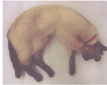
Sacha, chat siamois, animal domestique naturalisé Collection Museum-Aquarium de Nancy