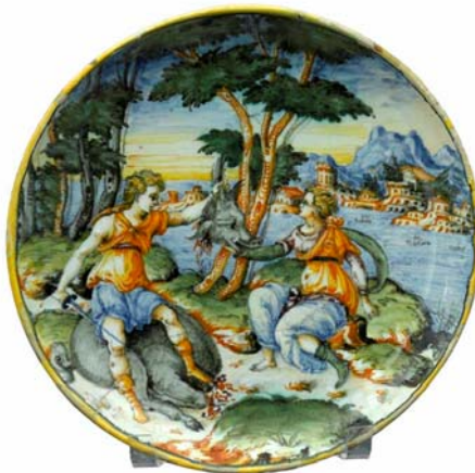
Plat, Atalante reçoit de Méléagre la tête du sanglier Calydon, Nevers, faïence de grand feu, 17 e siècle, musée Anne-de-Beaujeu

On retrouve cette vision avec Méléagre , héros antique, qui prouve son courage en abattant le sanglier qui terrorisait la région.